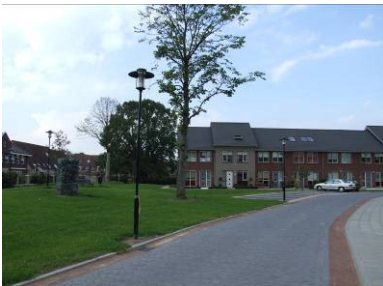
Ruimte voor spelen rondom de Glashof?