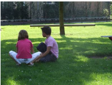
Ontmoeting en rust...