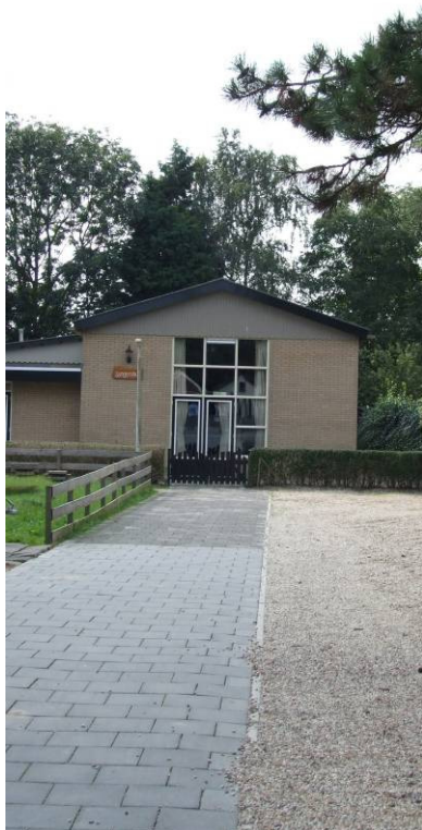
Informeel spelen toegestaan?

Er wonen een paar jongeren in Oosterwijk. Zij kunnen relatief eenvoudig naar Leerdam, waar ze ook naar school gaan, om te sporten en te ontmoeten. Er staat op het kerkpleintje een bank om de boom (foto) waar ze kunnen zitten en ontmoeten.