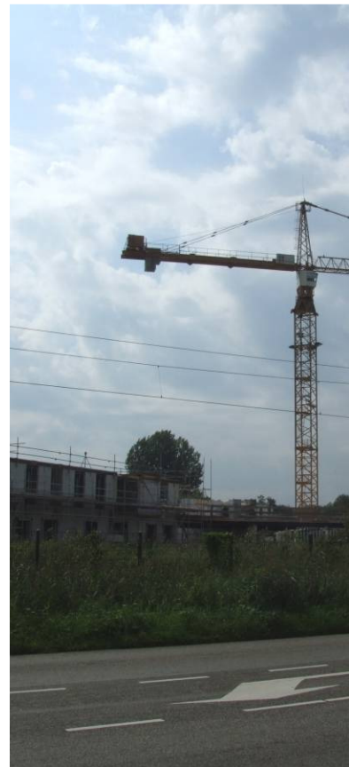
Bij nieuwbouw rekening houden met speelruimte!

In de gemeente Leerdam zijn diverse woningcorporaties (Stichting Wonen Leerdam, Woningbouwvereniging Ideaal Wonen Lingewaal) en projectontwikkelaars actief. De woningcorporatie is ook verantwoordelijk voor de leefbaarheid van de wijken en buurten en zorgt daarom soms ook voor het aanbieden van speelruimte. Ook bij nieuwbouw- of herstructureringsprojecten waarbij projectontwikkelaars zijn betrokken, stelt de gemeente kaders en stuurt ze op het gebied van speelruimte. Een voorbeeld is de ontwikkeling van de Raadsliedenbuurt in Leerdam West waar de gemeente afspraken heeft gemaakt met de projectontwikkelaar over het aantal vierkante meters speelruimte in de nieuwe buurt en het bedrag dat de ontwikkelaar moet reserveren voor nieuwe speelvoorzieningen. Daarnaast is ook de 3%-norm (drie procent van de voor wonen bestemde ge-