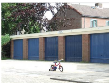
Leren fietsen op de stoep

Zintuigen van kinderen worden door buiten spelen op verschillende manieren geprikkeld. De zintuiglijke ontwikkeling zoals van de reuk, het gehoor, de tastwaarnemingen en ook de auditieve waarnemingen worden beïnvloed door het spelen. Maar ook bijvoorbeeld het geheugen wordt gestimuleerd bij het buitenspelen.