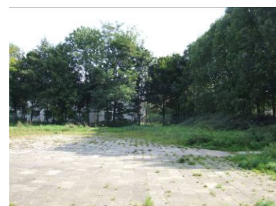
Terrein Steenovenweg / Kon. Julianastraat [Z14]

De jongeren kunnen voor sport en ontmoeting ook terecht op het terrein van de Steenovenweg/Kon. Julianastraat. Indien [Z14] wordt gerealiseerd, is dit naast een plek voor de jeugd ook een geschikte plek voor de jongeren.