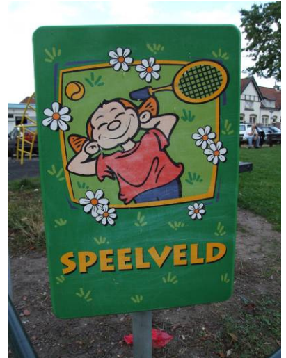
Bord bij enkele speelplekken

In Bijlage I wordt nader ingegaan op het begrip speelprikkel.