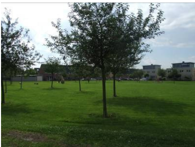
Speelplek [23] Copierlaan

OBB adviseert om de huidige speelplekken te behouden. Om de jeugd iets meer uitdaging te bieden, zou meer ingezet kunnen worden op uitdagende draai- en zwaaitoestellen. Daarnaast is op speelplek [23] in het park voldoende ruimte om te voetballen. Het is aan te bevelen dit te faciliteren met mini- of mididoeltjes. Tevens is het voor de oudere jeugd leuk om op deze plek zitplaatsen of bankjes te hebben.