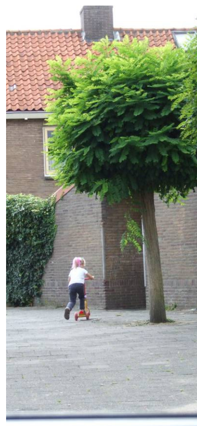
Informele speelruimte Leerdam West

OBB adviseert om de informele speelruimte die er is te behouden. Door het gebrek aan voldoende informele speelruimte zijn de formele speelplekken hard nodig in Leerdam West. De informele speelruimte kan aantrekkelijker gemaakt worden door het plaatsen van speelprikkels in het straatbeeld. In Bijlage I is een toelichting gegeven op het begrip 'speelprikkel'.