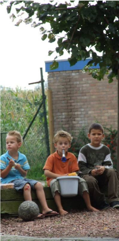
Spelen dicht bij huis

Schoonrewoerd ligt een paar kilometer ten noorden van Leerdam. De Dorpsstraat is een belangrijke as in het dorp waaraan zich de winkels, een kerk en een café bevinden. Voor de kerk ligt een plein met bankjes en bomen. Centraal in het dorp ligt een kinderboerderij. De woningen in het dorp zijn voornamelijk eengezinswoningen gelegen in planmatig ontwikkelde woonbuurten.