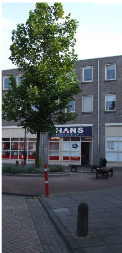
Informele speelruimte in het Centrum

Uitgezonderd grotere gebouwen als de kerken, het stadhuis, hof Hofje en enkele nieuwe winkelcomplexen is de bebouwing in het centrum kleinschalig van karakter. In het bijzonder de zone tussen de Zuidwal en de Kerkstraat is rijk aan waardevolle gebouwen zoals het Oude Raadhuis, de kerk, het Huis van de Drossaert en het Hofje van mevrouw Van Aerden. Het waterfront en de stadswallen zijn daarnaast specifieke kenmerken van het centrum die ook een speel- of ontmoetingsaanleiding kunnen vormen. De structuur van de binnenstad wordt overwegend bepaald door gesloten bouwblokken met bebouwing die zich op de openbare ruimte oriënteert.