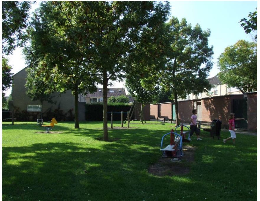
Spelen op speelplek [3] achter de Sarvaasstraat