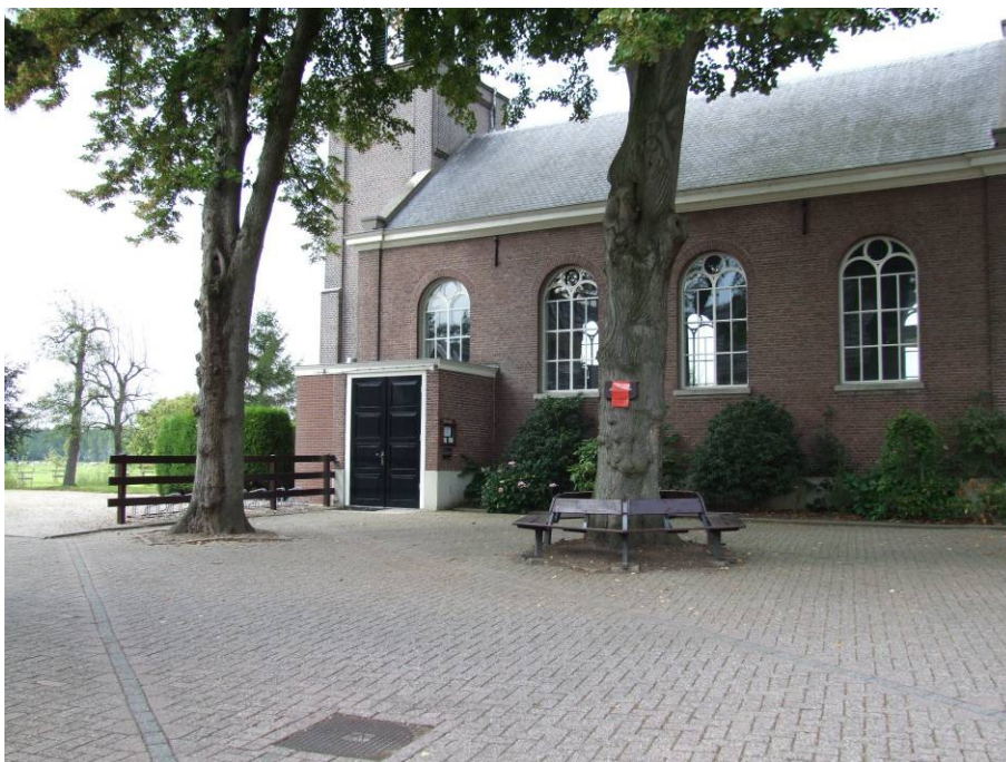
Informele speel- en ontmoetingsruimte Oosterwijk