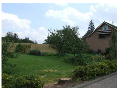
Veldje aan Oudendijk