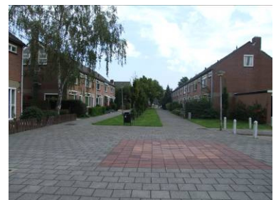
Informele speelruimte op de stoep.

In deze beleidsbrief spreekt de regering haar zorg uit over het feit dat kinderen schijnbaar minder buiten spelen en dat dit zou komen door een tekort aan speelruimte en ontwikkelingsmogelijkheden. De minister verzoekt de gemeenten om in de ruimtelijke plannen voldoende ruimte te bestemmen als formele speelruimte. Als richtgetal is 3% van de voor wonen bestemde gebieden te reserveren als speelruimte. Stoepen en vergelijkbare openbare ruimte worden hierin niet meegeteld. Groenvoorzieningen bijvoorbeeld wel, mits deze geschikt zijn voor spelen en de omschrijving in het bestemmingsplan duidelijk maakt dat de gebieden met deze bestemming als speelruimte kunnen fungeren. Naast voldoende speelruimte vraagt de minister de gemeenten ook aandacht te besteden aan de kwaliteit en de bereikbaarheid van de buitenspeelruimte.