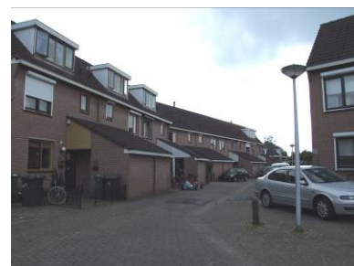
Kan je hier nog spelen?