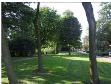
Wielkje van Collee

Geadviseerd wordt om de beschikbare informele speelruimte in deze wijk te behouden.