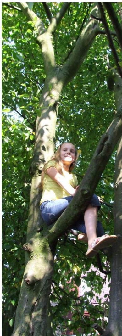
Boomklimmen op speelplek [32]

Leerdam Oost is een wijk waar de woonfunctie centraal staat. Naast de onderwijsvoorzieningen in de wijk liggen er ook enkele bovenwijkse voorzieningen als het ziekenhuis, de brandweerkazerne en het politiebureau.