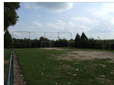
Trapveldje speelplek [51]

De circa 100 jongeren hebben genoeg plekken in het dorp om even bij elkaar te zitten. Naast de speelplekken kunnen ze op verschillende plekken langs de Dorpsstraat terecht. Ook kan deze leeftijdsgroep terecht in Leerdam zelf voor hun sport- en ontmoetingsvoorzieningen, omdat ze hier na school nog wel eens blijven hangen. Als formeel sportveld kan het trapveld op plek [51] Kerkeland wel aangewezen worden. Overwogen kan worden om hier een verharde ondergrond te maken vanwege de speeldruk van de jeugd en de jongeren. Ook het ontmoeten zou op deze plek gefaciliteerd kunnen worden.