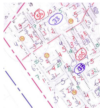
Kinderaantallen op kaart

Het analyse hoofdstuk is opgebouwd uit een algemeen deel met een korte beschrijving van de wijk, het percentage kinderen in de wijk en eventueel een beschrijving van bovenwijkse voorzieningen. Daarna wordt ingegaan op de kwantiteit en de kwaliteit van de informele en formele speelruimte in de wijk. Per wijk is door OBB een advies gegeven over de speelruimte (zowel informele als formele speelruimte).