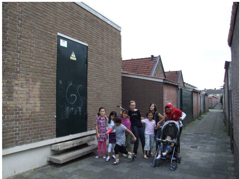
Meiden dansen, kletsen en ontmoeten in de achterpaden