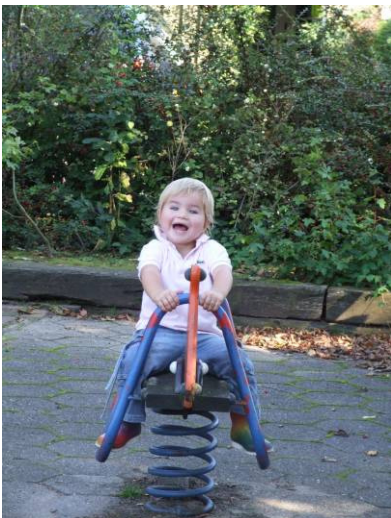
Kinderen (0-5 jaar)

Jongeren: jongeren in de leeftijd van twaalf tot achttien jaar (12-18).