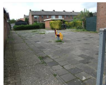
Wordt hier nog gespeeld?

Naast het spelen met toestellen is voetballen voor de jeugd een favoriete bezigheid. Ten noorden van de Tiendweg zijn twee grasrapveldjes, beide ten westen van de Jacoba van Beijerenstraat. OBB adviseert om ten oosten van de Jacoba van Beijerenstraat te investeren in een voetbalmogelijkheid voor de jongeren, waarvan ook de jeugd gebruik kan maken [Z5].