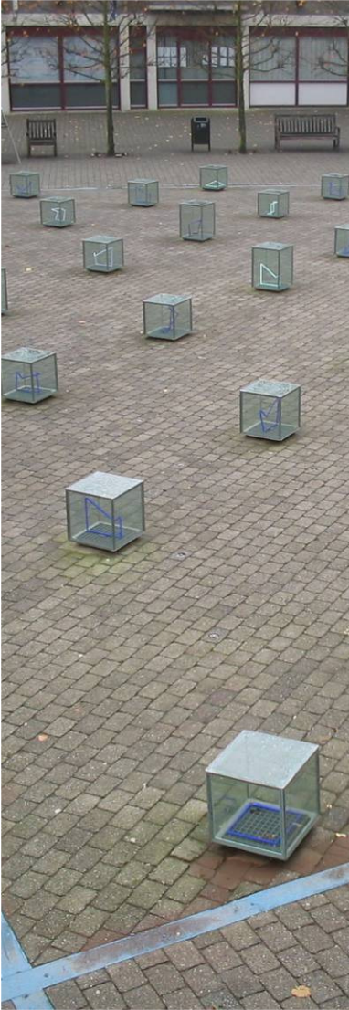
Ontmoeten in het Centrum